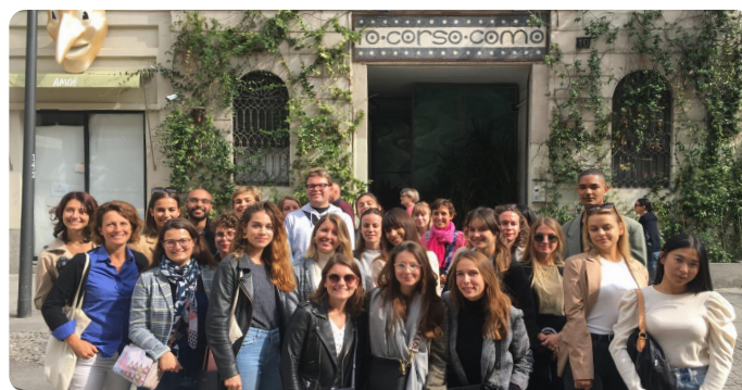
VOYAGE D'ÉTUDES À MILAN DU MASTER 2 - VISITE DU CORSO COMO

Le Master 2 Innovation, Design & Luxe est une année de spécialisation qui forme des managers capables d'être à l'interface entre les métiers du marketing et de la création, avec une soutenance du mémoire de Master.